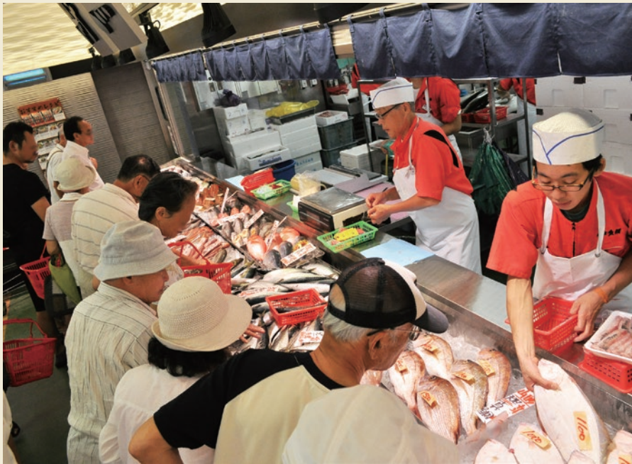
毎日新鮮な魚をお客様に提供することが角上魚類の使命であり喜びです。活気ある職場はやりがいに充ちています