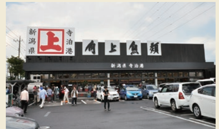
郊外立地ゆえ他社様より鮮度に拘り誘客して参りました