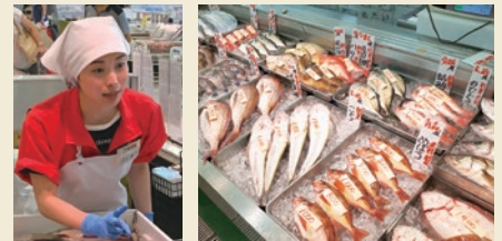
女性も接客販売や刺身、寿司の調理で活躍しています 豊州と新潟からの仕入で豊富な品揃えを実現しています