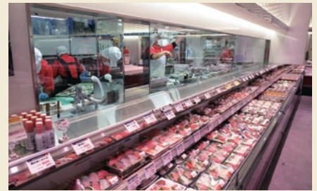
7月に改装した高崎店は作業場がガラス越しに見えます