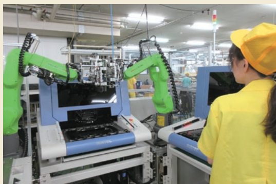
協働ロボットで試験工程を人間と調和して作業