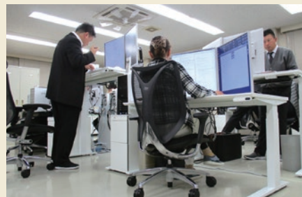
全員にスタンディングデスクや高解像度ディスプレイを配備、 快適な環境で仕事が行えます。