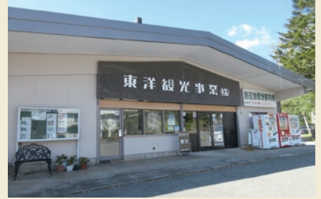
蓼科販売管理センター