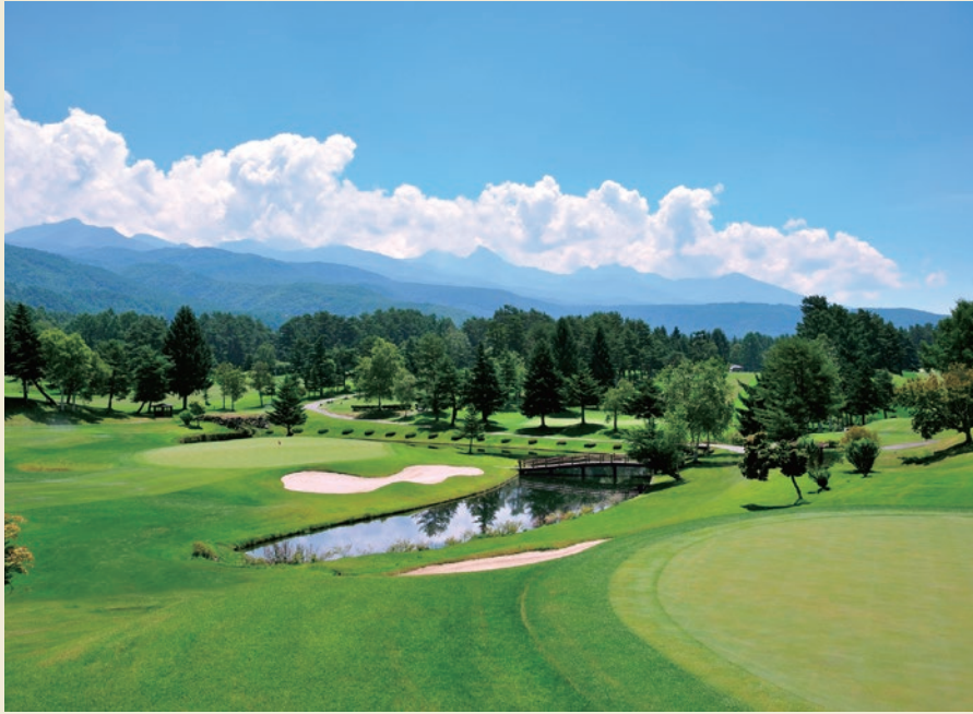
蓼科高原カントリークラブ

http://www.alpico.co.jp/tateshinakogen-cc/