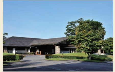
蓼科高原カントリークラブハウス