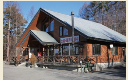
四季の森販売管理センター