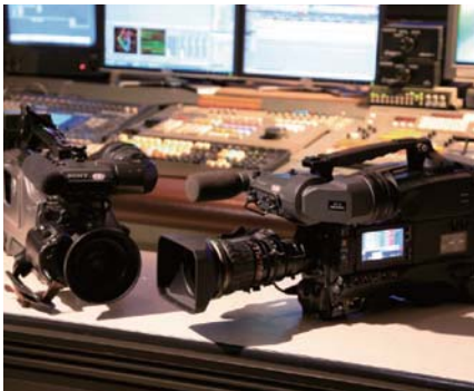
デジタルハイビジョンカメラ