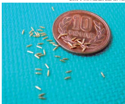
ショートプローブ