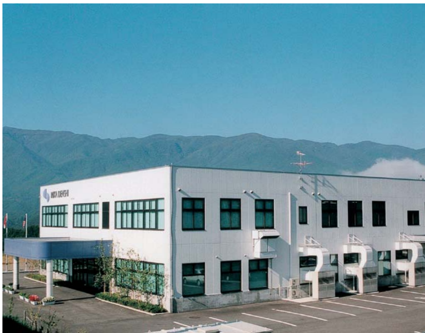
長野事業所富士見工場外観