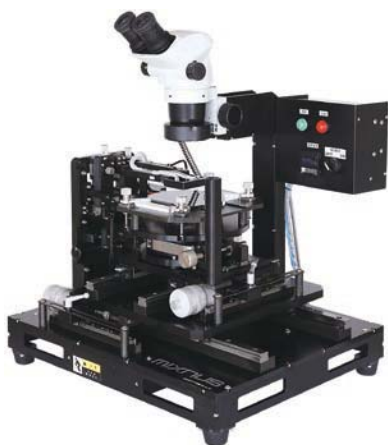
ダブルサイドマニュアルプローバー