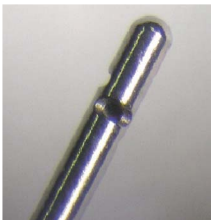
クレンジングニードル