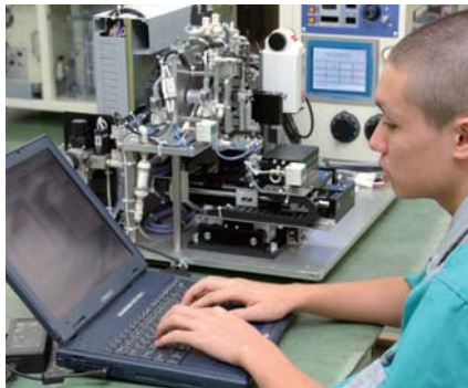
調整・プログラミング作業