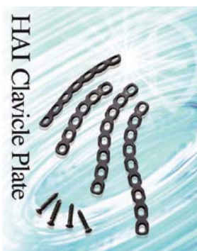
インプラント製品