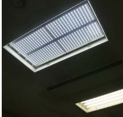
「アルクール」使用例 (LED照明裏面)