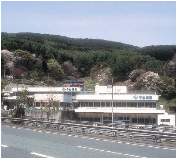
長野自動車道岡谷ICのすぐ近く。豊かな緑に映える薄桜色の建物が社屋です。