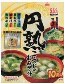
円熟こうじのおみそ汁