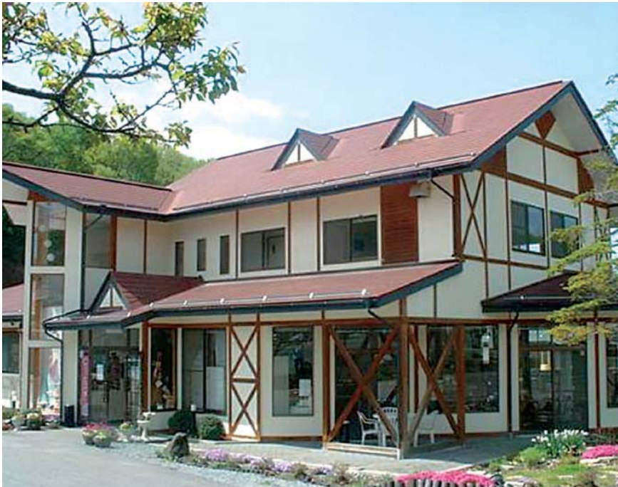
夢科高原ケーキファクトリーパークと茅野店