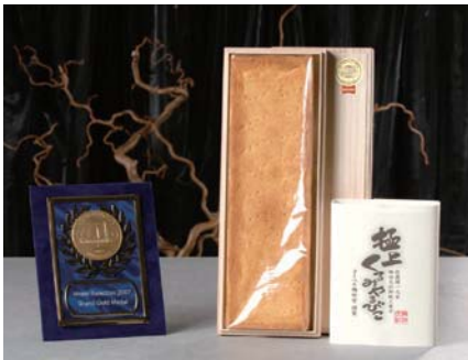
2006・2007・2008・2009モンドセレクション4年連続最高金賞受賞 信州銘菓「くるみやまびこ」