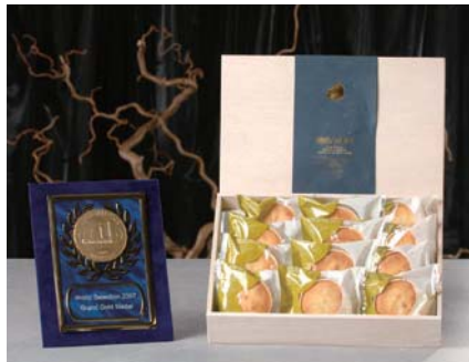
2007モンドセレクション最高金賞 「諏訪の月」