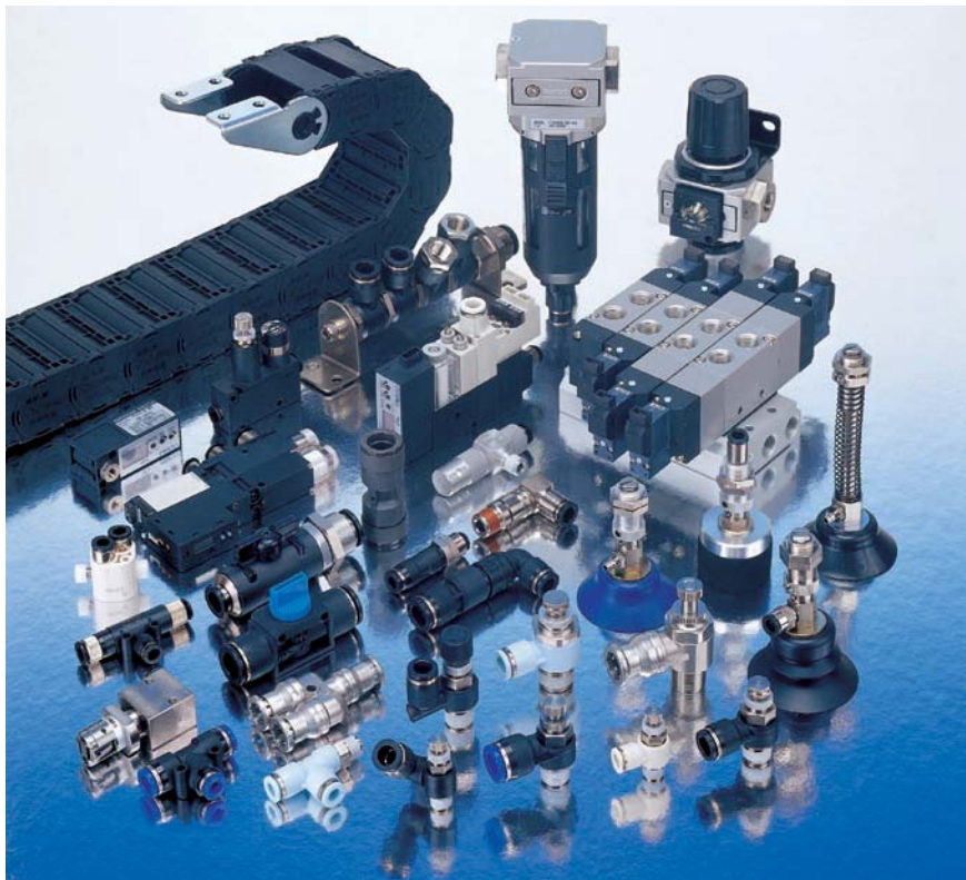
世界中のあらゆる業界で活躍し、利用されているピスコの空気圧機器