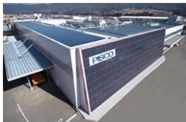
太陽光発電パネル