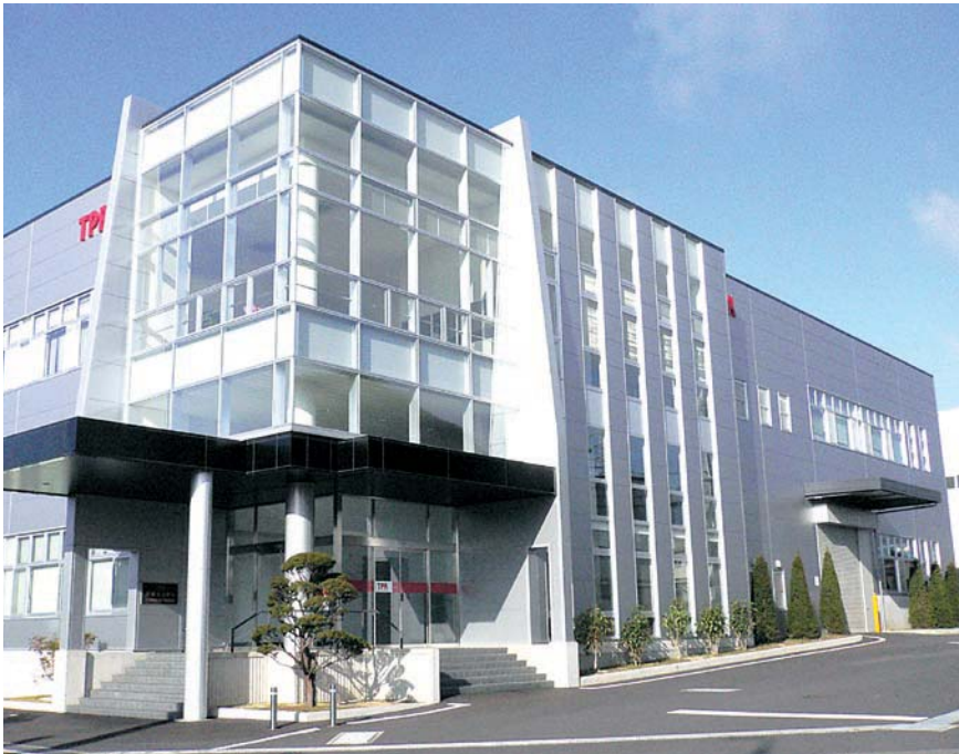
2004年9月に完成した当社の技術の発信源 技術センター棟