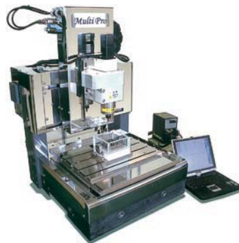
多機能デスクトップ加工機