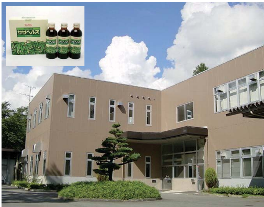
蓼科工場 (上原山林間工業公園内)