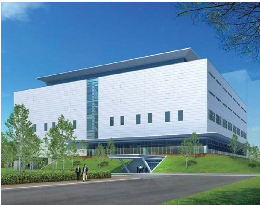
茅野工場新社屋 2010年6月竣工予定