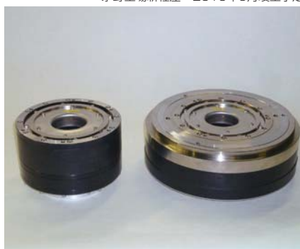
高トルク・高精度なアウトロータ型ダイレクトドライブモータ