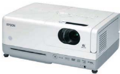
自宅でも高精細な映像が楽しめる ホーム・シアター・プロジェクター