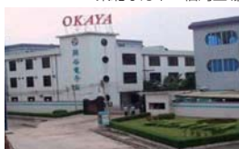
東莞東坑岡谷電子廠