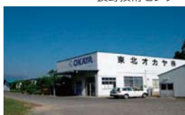
東北オカヤ 福島工場