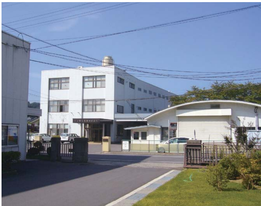
長野技術センター