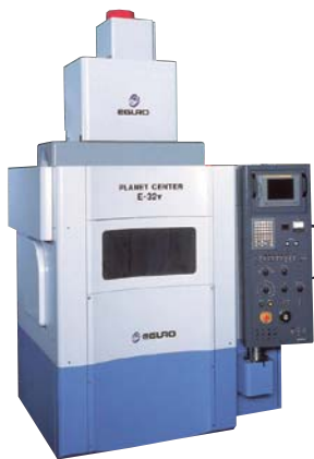
21世紀日本の製造業をサポートする最新機械