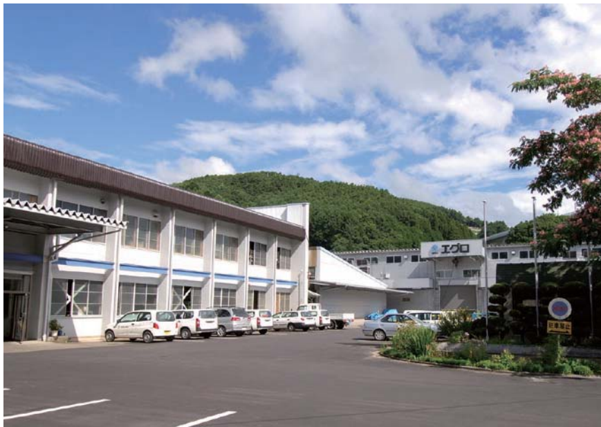
「ときめき工場」づくりを推進する本社組立恒温工場