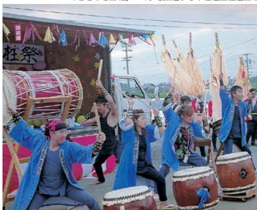
若くエネルギー溢るエグロ太鼓連