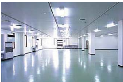
クリーンルーム室内 (2500㎡、7フロア)