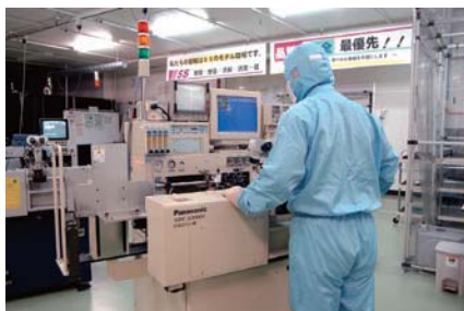
ワイヤーボンディング実装、他