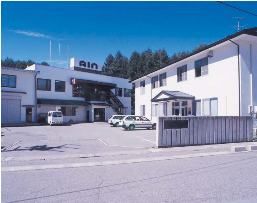
アイソ本社工場 ISO9001・14001認証取得