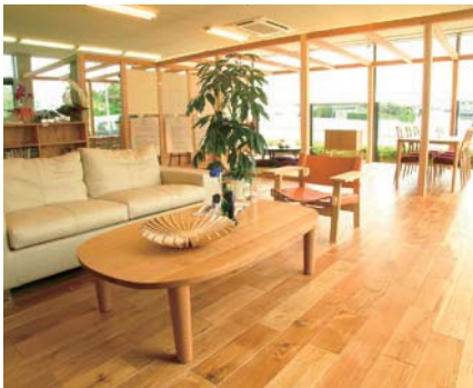
本社1階にある自然素材に囲まれたスタジオ